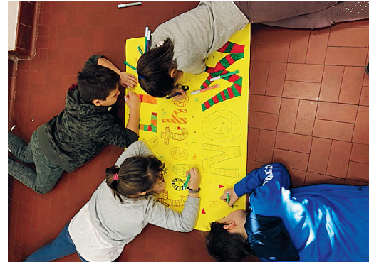
A sin. gli alunni della classe terza; sotto e a destra i disegni per il progetto "Avo"

famiglia, a casa. A noi piacerebbe ricevere quei giocattoli perché è davvero un pensiero dolce "donare" e, se fossimo al loro posto, ringrazieremo con tutte le nostre forze chi ci ha donato un proprio gioco. La nostra classe ha anche preparato dei bigliettini con delle letterine per rassicurarli e per renderli felici, da attaccare all'albero, in ospedale. Potremmo fare ancora di più: potremmo creare un cuore gigante con scritti i nomi dei bimbi ammalati, per scaldarli di amore».