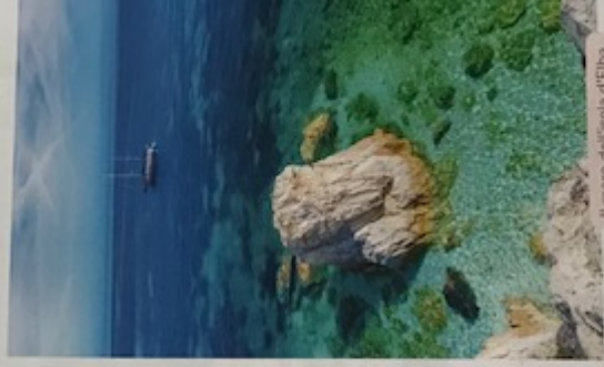
Il mare dell'isola d'Elba.

Il turismo è una voce importante per l'economia regionale. Sono molto apprezzate le località della costa e le bellissime colline, dove si è sviluppato l'agriturismo. Ma sono soprattutto le città d'arte a richiamare i turisti.