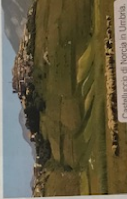
Castelluccio di Norcia in Umbria.

In queste regioni sono molte le testimonianze architettoniche di un passato ricco di storia , avendo visto la nascita e lo sviluppo della civiltà romana che per lunghi secoli ha dominato su un territorio vastissimo. Durante il Medioevo e il Rinascimento, sono sorti Comuni e Stati indipendenti. A questo periodo risalgono capolavori artistici che ritroviamo ancora oggi in questa parte d'Italia.